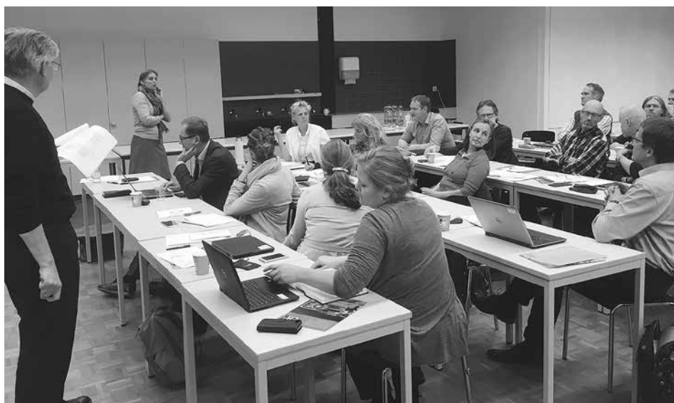
Workshop d'accréditation de fh-ch et actionuni le 8 novembre 2017 à Berne

Les pistes de réflexion ne manquent pas ; les bonnes pratiques non plus, à la HES-SO comme ailleurs. A nous toutes et tous, ensemble, de se saisir de cette thématique pour la faire évoluer au bénéfice des personnes qui veulent bien s'impliquer et de l'institution. ■