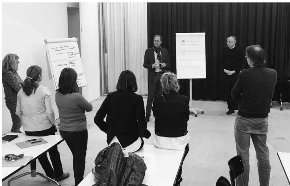
Akkreditierungsworkshop in Bern

Ein Blick auf den weitgehend formalisierten Ablauf eines Akkreditierungsverfahrens zeigt drei Phasen: Die Vorbereitung durch die Hochschule, den eigentlichen Akkreditierungsprozess, der mit dem Einreichen deren Akkreditierungsgesuchs beginnt und nach vorliegendem Abschlussbericht eine Umset-