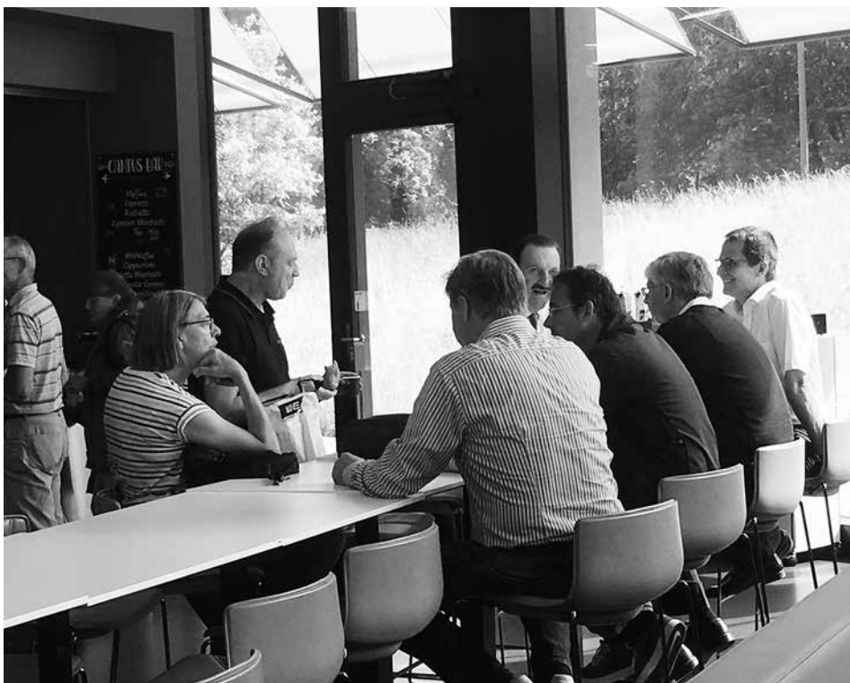
DV fh-ch vom 9. Juni 2018 am Campus FHNW in Brugg-Windisch: Begrüßungskaffee in der Cafeteria

L'initiative pour un congé paternité, munie de 107000 signatures, a été déposée le mardi 4 juillet 2017 auprès de la Chancellerie fédérale. Elle réclame un congé paternité de quatre semaines sur le même modèle que le