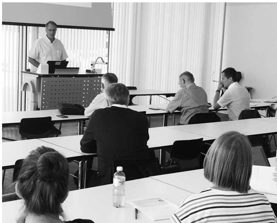
AD fh-ch le 9 juin 2018: Rapport annuel du Président

C'est la compétition et l'arrivée sur le marché de nouveaux acteurs qui stimulent l'innovation, la compétitivité et la performance. On ne gagne pas une course en empêchant les autres de courir, on gagne une course parce que justement les concurrents nous incitent à nous surpasser. Rien ne nous empêche par