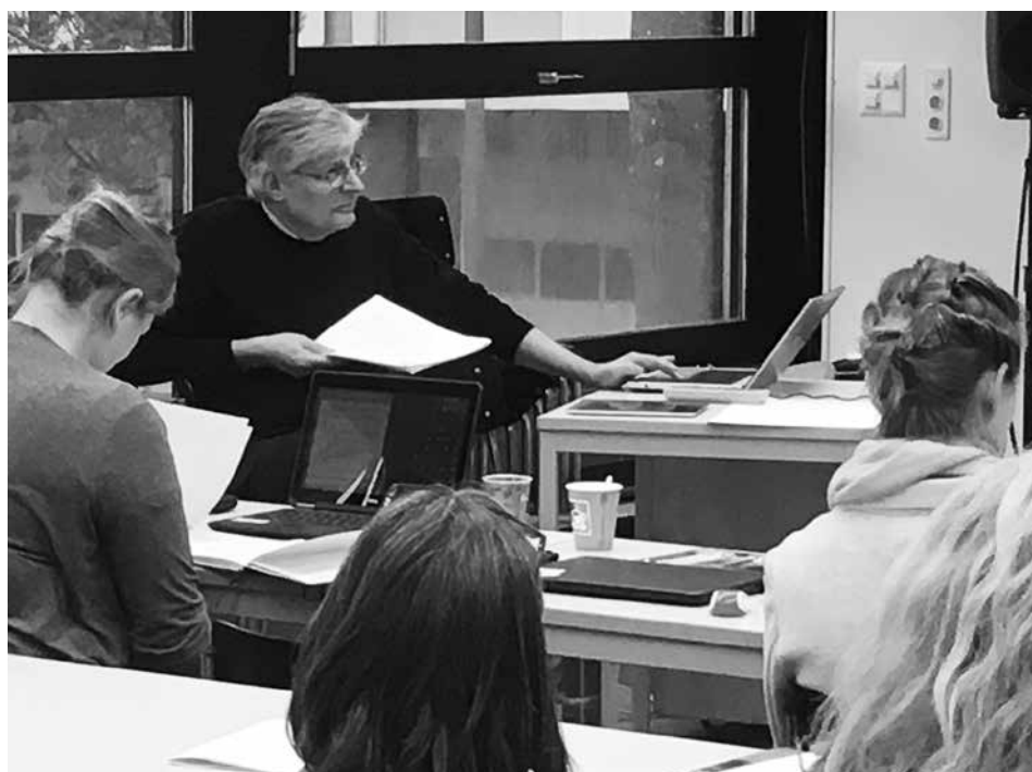
Akkreditierungsworkshop in Bern

Delegation: Mitwirkung braucht Delegierte. Nicht alle können in die Entscheidungsprozesse voll involviert werden. Aber die Delegierten brauchen Unterstützung, nicht nur, dass sie auf zeitliche und finanzielle Ressourcen angewiesen sind. Sie brauchen auch das Vertrauen und die Rückendeckung ihrer Kolleginnen und Kollegen. ■